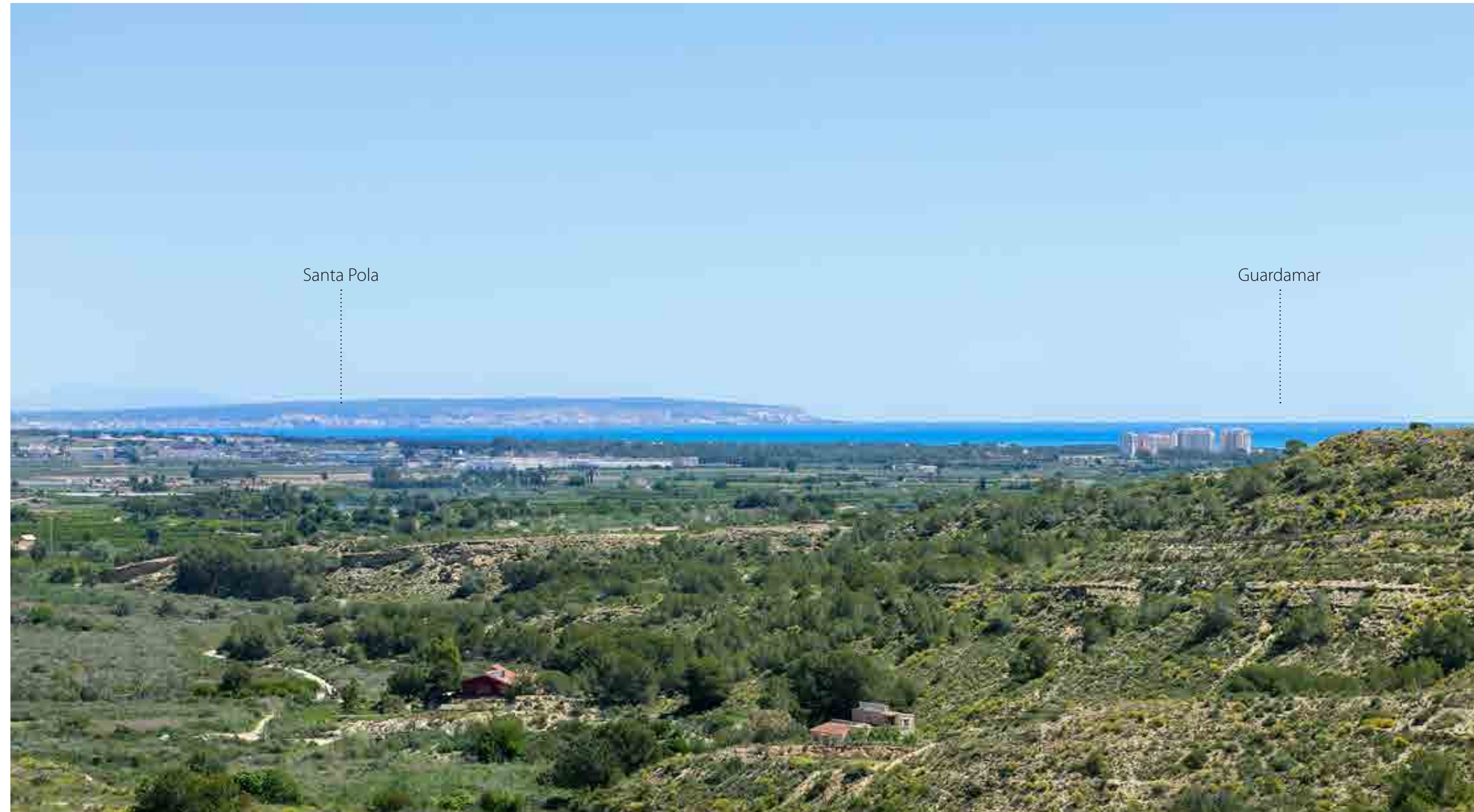
VISTA DESDE LA PARCELA